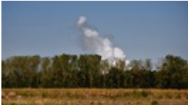
Ground Cloud, 2015