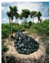
Gota (Drop), aus der Serie „Washed Up: Transforming a Trashed Landscape“, 2011