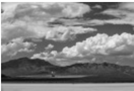
# 10984, 4 September,

aus der Serie „The Evolution of Ivanpah Solar“, 2015