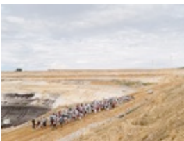
Tagebaubesetzung # 070,