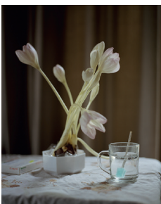
Flowers for Ben