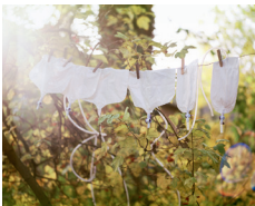
Ben's catheter bags