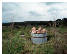
Brothers in a tub