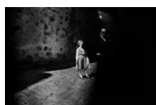
La bambina e il buio. Baucina 1980