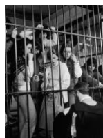
Le ragazze di Prima Linea. Torino, 1981