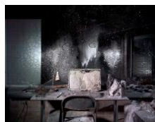
Still in Life, 2014