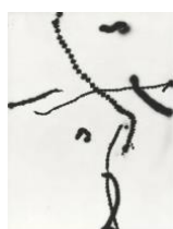
L6, detta Profilo, 1991. Aus der Serie »Lucciole«, 1988-1991