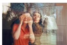
Self Portrait with My Mother, 2011

Pressekonferenz: Donnerstag, 30. Januar 2020, 12 Uhr