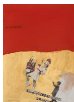
The New Feminism, 2016