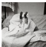
Ushioda Tokuko, Untitled, 1983;