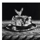
Kon Michiko, Inada + Bōshi (Yellowtail and hat), 1986.