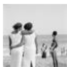
Victoria Island, Lagos. Aus der Serie Sea Never Dry, 2006