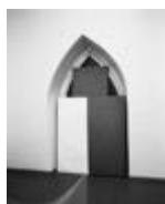
Aus der Serie Cults of Performance, 2019