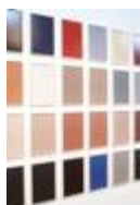
Ein ruhiger Tag. 73 Farbtafeln (1936-2009), 2016