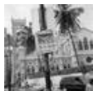
Lagos Island. Aus der Serie Lagos: All Roads, 2016