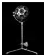
Das imaginäre Studio I, 2017