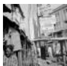
Lagos Island. Aus der Serie Lagos: All Roads, 2004

Eröffnungs-Pressekonferenz: Mittwoch, 02. Juni 2021, 11 Uhr (digital)