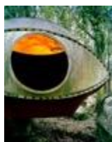
Lovag I, 2013. Aus der Serie Eurotopians

Eröffnungs-Pressekonferenz: Mittwoch, 02. Juni 2021, 11 Uhr (digital)