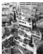
Gailhoustet/Renaudie V, 2016. Aus der Serie Eurotopians