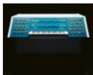
Das imaginäre Studio III, 2017