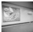
Berlin Wedding. Aus der Serie African Quarter, 2005