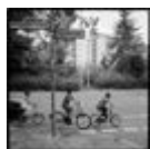
Berlin, Wedding. Aus der Serie African Quarter, 2005